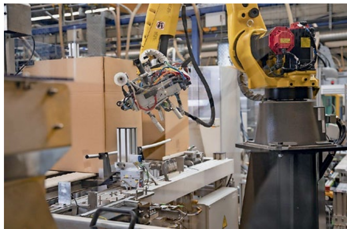
Ein M20i von Fanuc übernimmt das Handling der Bauteile aus einer Roboshot-Spritzgießmaschine von Fanuc, auf der zwei Teile zur Not-entriegelung eines Automatikgetriebes gefertigt werden: ein Steckschlüssel und ein Gehäuseeteil.